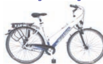
Solero Alu Light 21-Gang/7-Gang